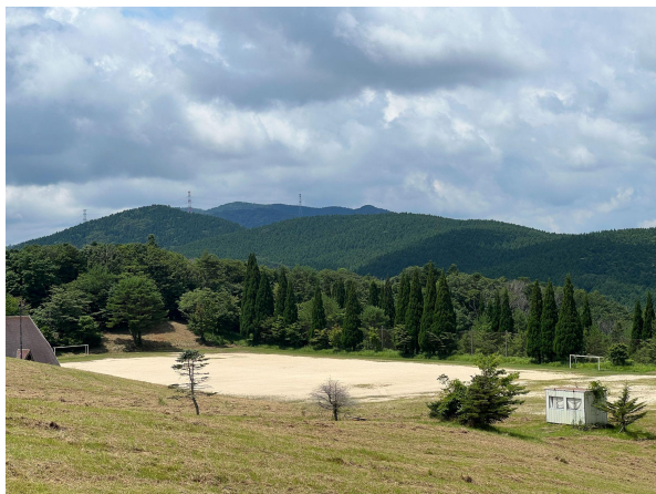
多目的グラウンド